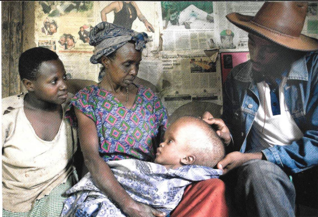
Hydrocephalus komt als aparte aandoening heel veel voor.

De nood is enorm groot. Daar kan nu maar beperkt in worden voorzien. Om meer hulp te kunnen bieden is er meer