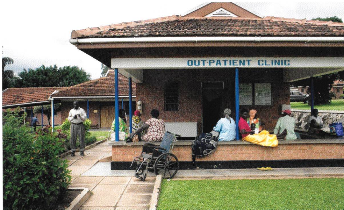
Child-Help steunt klinieken waar baby's met SBH kunnen worden geopereerd.

Kijk voor meer informatie over doneren aan Child-Help op www.child-help.nl IBAN: NL40 ABNA 0246 0673 06